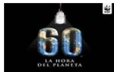
Apaga la luz, enciende el planeta