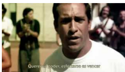
Si se quiere se puede- esforzarse es vencer