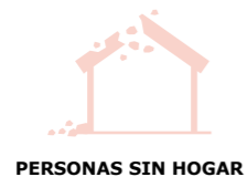
PERSONAS SIN HOGAR

Todos los proyectos jurídicos Pro Bono de la Fundación pretenden mejorar el acceso a la justicia de personas en situación vulnerable, especialmente de los colectivos que son prioritarios para la Fundación.