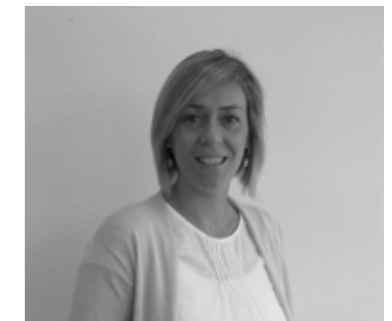
Victoria Aravaca Administrativa