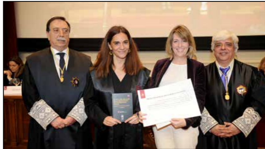
Premio jurídico Memorial Degá Roda i Ventura del Ilustre Colegios de Abogados de Barcelona, a la mejor monografía jurídica del año en 2016

Nuestro trabajo se centra en concienciar sobre la labor de las asesorías jurídicas de empresas y de los despachos de abogados respecto a su asesoramiento (a empresas) en materia de derechos humanos.