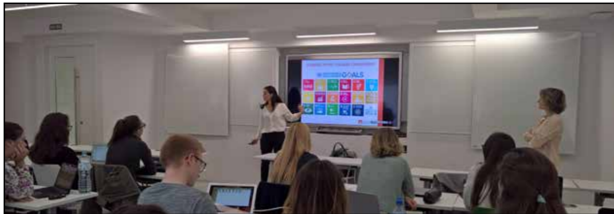
Formación en el IE Law School.