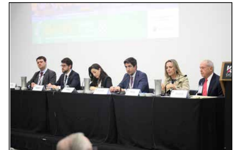
IBA Rule of Law Symposium, Sídney, Australia.

Asimismo, Ana fue ponente en el panel: « Best practice in communication and empowerment of local social leaders through pro bono », donde expertos e